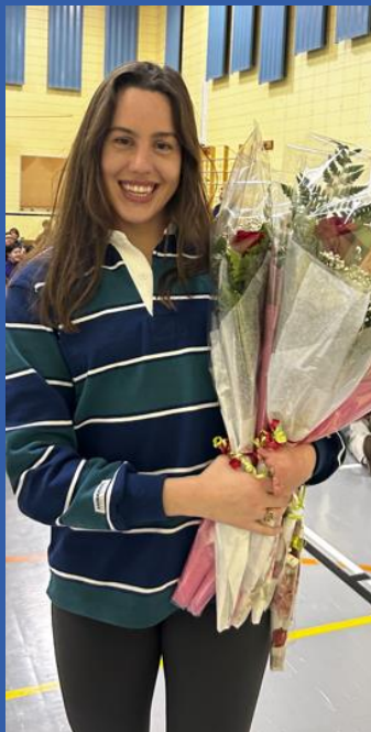
Conférence d'Aurélie Rivard, une passionnée de la natation et athlète paralympique

Aux enseignants dévoués qui, chaque jour, partagent leur savoir et inspirent nos élèves, merci pour votre passion et votre persévérance. Vous avez su créer un environnement d'apprentissage stimulant et bienveillant qui a permis à nos enfants de s'épanouir et de développer leurs compétences.