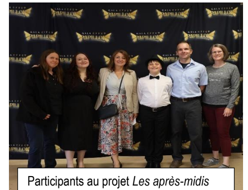
Participants au projet Les après-midis des passionnés